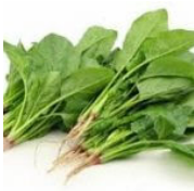
Spinach (Pahadi Palak)