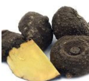
Githi / Yams