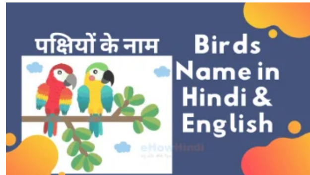
30 Birds Name in Hindi and English - Pakshiyon ke Naam