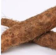
Jangli Tedu / Yams