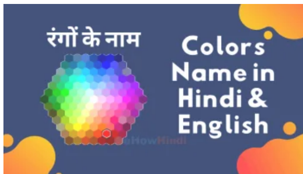
30 Colors Name in Hindi and English - Rango ke Naam