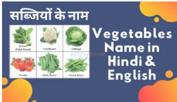
100 Vegetables Name in Hindi and English - Sabziyon ke Naam